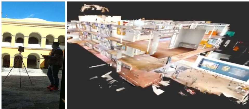
Figura 8. Evidencia de digitalización 3D de la sede Belén (equipo Matterport).

Se desarrolló la digitalización 3D para generar un modelo digital de la sede Belén, esto con el fin de usarlo como un método alternativo con el que se puedan comparar y complementar los modelos de información generados a partir de los procesos explicados en los puntos anteriores. Esta digitalización se realiza con equipo Escaner 3D, marca Matterport, modelo Pro 2, con tecnología a base de luz infrarroja y fotografías de gran formato.