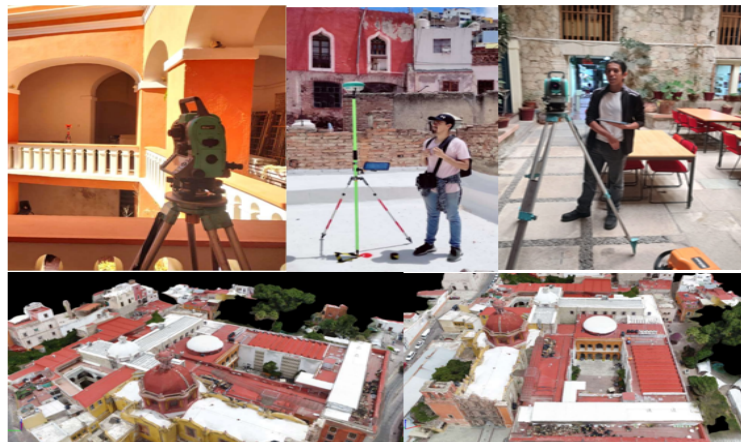
Figura 6. Evidencia del levantamiento de coordenadas de los puntos fijos de referencia para enlace de coordenadas.

Con el apoyo de alumnos que cursan la materia de topografía, se realizaron trabajos de ubicación de puntos físicos en sede Belén para las referencias topográficas con el uso de estación total (marca Nikon, modelo NIVO 5C), un DRON (marca DJI, modelo MAVIC AIR 2) y GPS (GNSS, marca Sokkia, modelo 2700ISX).