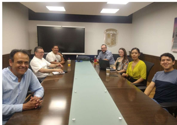
Figura 2. Evidencia de reuniones de trabajo para el desarrollo de las estrategias y seguimiento de las actividades.

Se convocó a los miembros de los departamentos de la sede Belén de la Universidad de Guanajuato que participarían en el proyecto, se les habló acerca del interés de implementar un plan de ejecución BIM y se puso en marcha el proyecto.