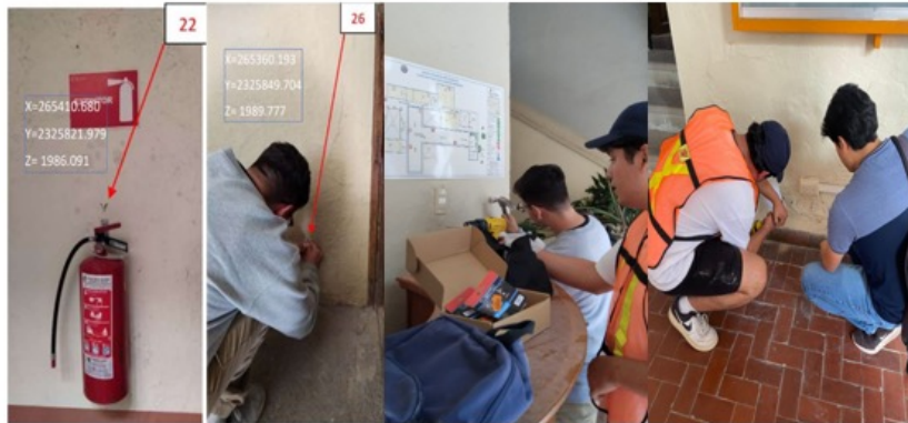
Figura 5. Evidencia de colocación de puntos fijos colocados estratégicamente en la unidad Belén para el enlace de coordenadas a los archivos digitales.

Se realizó una propuesta física con placas para asignar puntos que serán base para el modelo ya generado en Autodesk Revit y se georreferenció.